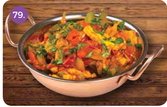
79. VEGETABLES KADAI 2.500 (mixed Vegetables Cooked in a Thick Tomato and Capsicum Gravy with a Variety of Mild Spices)

(خضروات مشكّلة مطبوخة في صلصة الزبدة والطماطم)