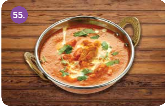
55. MURG MAKHANI (Tandoori Chicken Pieces Cooked in Butter and Tomato Based Gravy)