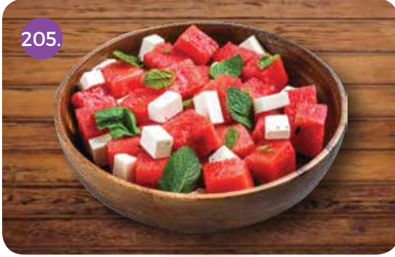
205. WATERMELON & FETA CHEESE SALAD (Watermelon, Feta Cheese, Lemon Mint Dressing)