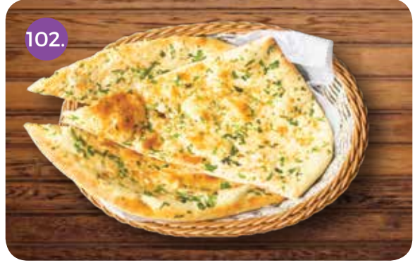
102. NAAN AAP KI PASAND (BUTTER / GARLIC)