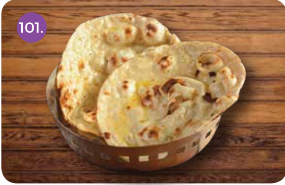
101. ROTI AAP KI PASAND (PLAIN / BUTTER)