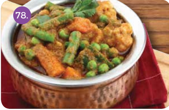
78. VEGETABLES MAKHANI 2.500 (mixed Vegetables Cooked in Butter and Tomato Based Gravy)