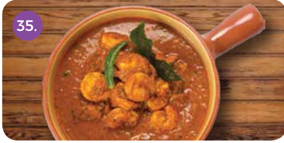
35. JHINGA DUM MASALA 3.600 (Stir Fried Prawns in Fresh Tomato Gravy Cooked on Dum)