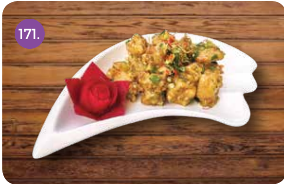
دجاج مقرمش حلو وحاد (صلصة البرقوق ازيت الفلفل الحار ازنجبيل)