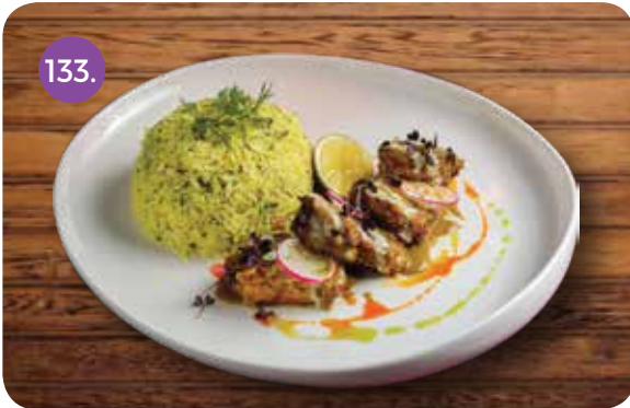
4.900 غوزي لحم (أرز بالزعفران | سلطة بصل | بطاطا مقلية)