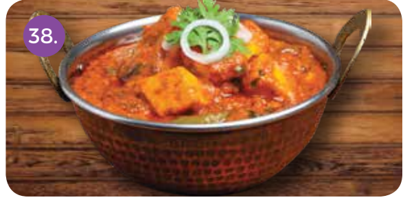
38. روبيان دوم ماسالا (روبيان مقلي في صلصة طماطم طازجة ومطهو بطء )