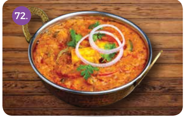
72. PANEER TIKKA MASALA (Tandoori Cottage Cheese Cooked with Onion and Tomato Gravy)