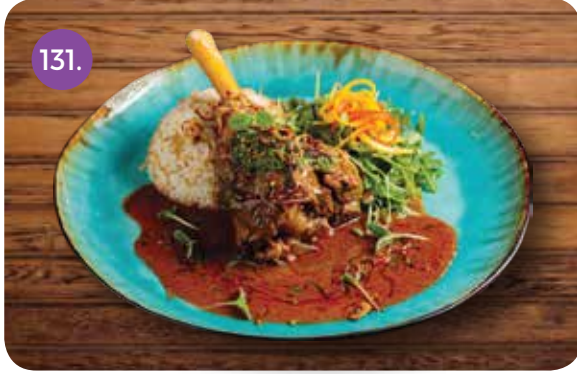
131. NZ LAMB SHANK (Vermicelli Rice, Spicy Chimichurri Sauce)