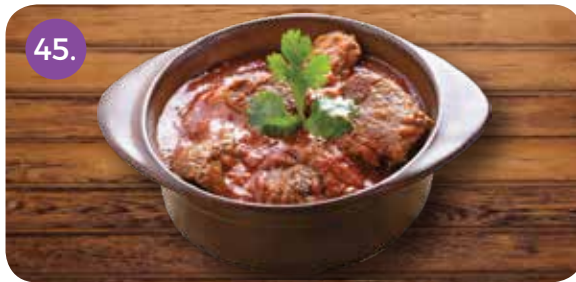
لحم ضأن مع خضار ورقية (مكعبات من لحم الغنم متبل في بهارات هندية ومطهوه مع السبانخ)