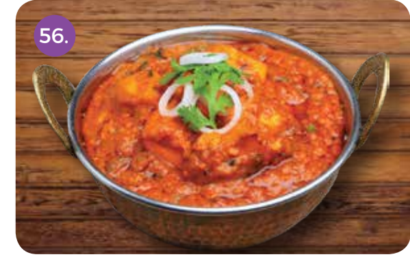
56. MURG TIKKA MASALA (Tender Cubes of Tandoori Chicken Cooked with Onion and Tomato Gravy)