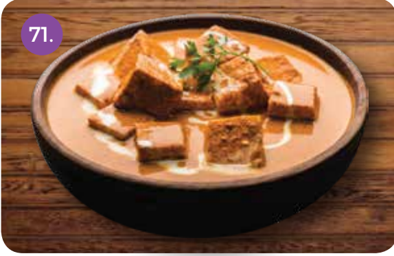
71. PANEER MAKHANI (Cottage Cheese Cooked in Butter and Tomato Based Gravy)