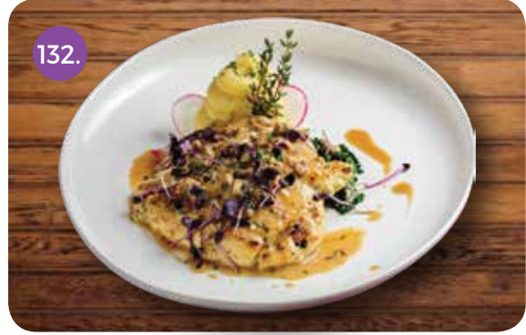
132. GRILLED CHICKEN BREAST (Mashed Potato, Mushroom Sauce)